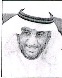
• عن الحجرف

وأكد الحجرف أن كلية التمريض ستقوم مباشرة بالتحضير للمرحلة الرابعة والأخيرة من مراحل الحصول على الاعتماد الأكاديمي وذلك من خلال تحديد موعد زيارة الاعتماد الأولي بعد تقديم تقرير بشأن الزيارة إلى مجلس مفوضي هيئة ACEN والذي بناء عليه يصدر قرار بمنح البرامج الاعتماد الأولي لمدة 3 سنوات