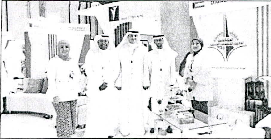
• حجرف الحجرف مع أعضاء الوفد

55 نهدف للاطلاع على آخر المستجدات والإنجازات بالشأن الأكاديمي